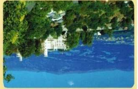
Sport, Kunst & Kultur!

Fußweg zum Schloss Wolfsberg (15 Minuten).