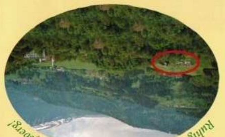
Ruhige Lage mit schönem Blick auf Wolfsberg!

Sitzplätze für insgesamt 150 Personen. Terrasse für 80 Personen.