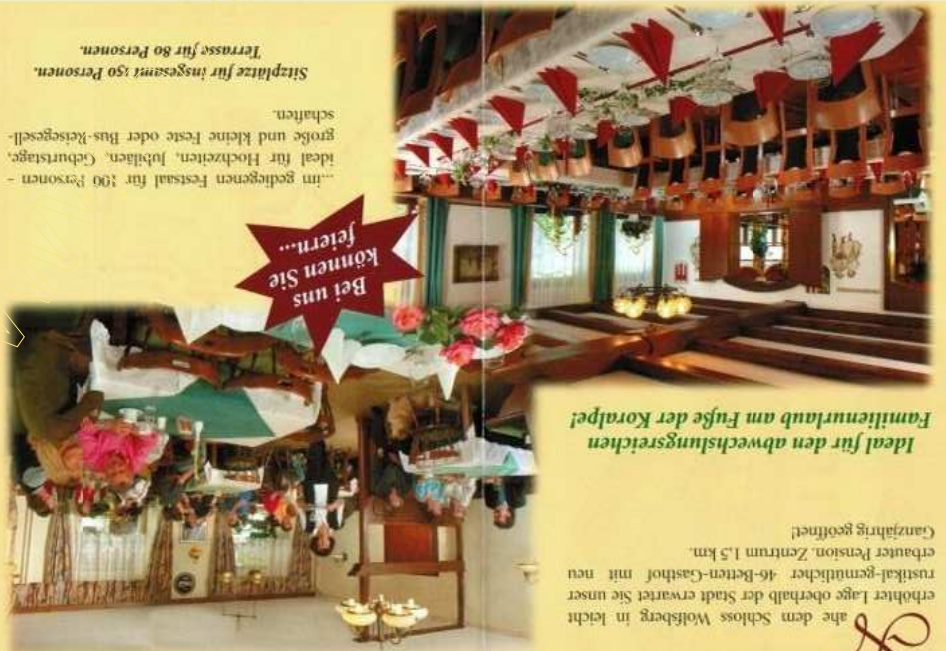
Ideal für den abwechslungsreichen Familienurlaub am Fuße der Koralpe!

Im nahe dem Schloss Wolfsberg in leicht erhöhter Lage oberhalb der Stadt erwartet Sie unser rustikal-gemütlicher 46-Betten-Gasthof mit neu erbauter Pension. Zentrum 1,5 km. (Janzjährig geöffnet)