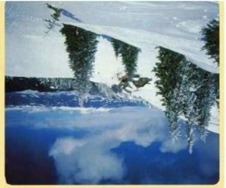
Rein ins Schi-, Snowboard- od. Langläuervergnügen!

Badespaß im Stadtbad. In näher Umgebung: Wandern auf der Koralpe, Radeln, Golfen, Reiten.