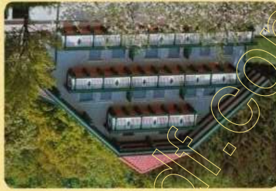
Neu erbaute Pension

Klippitzhörl. Nur 2 km zur A 2/Abfahrt Wolfsberg-Nord. Kärntner Badesee (40 km), Sommerrodellbahn am Griffen, die Burg Hochosterwitz oder die schönsten Besuchen Sie das Lavanttal, das Benediktinerstift St. Paul. Ideal erreichen Sie die schönsten Ausflugsziele!